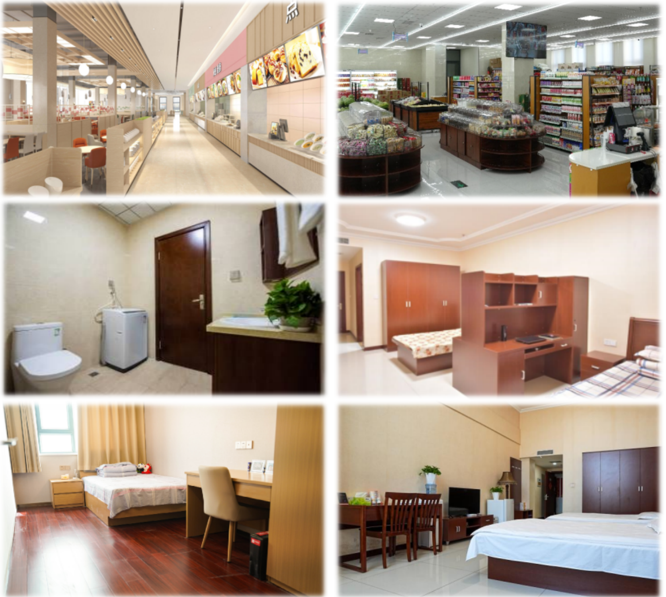
上图：食宿环境（商务区及项目公司）