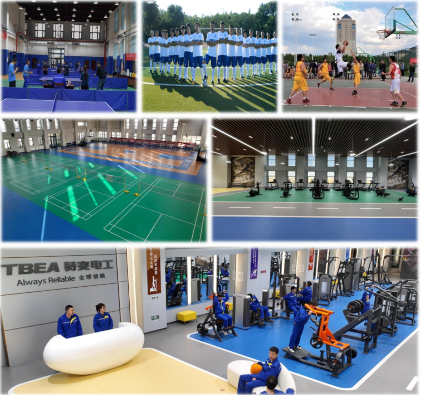
上图：室内健身、运动场所（羽毛球、篮球、乒乓球）