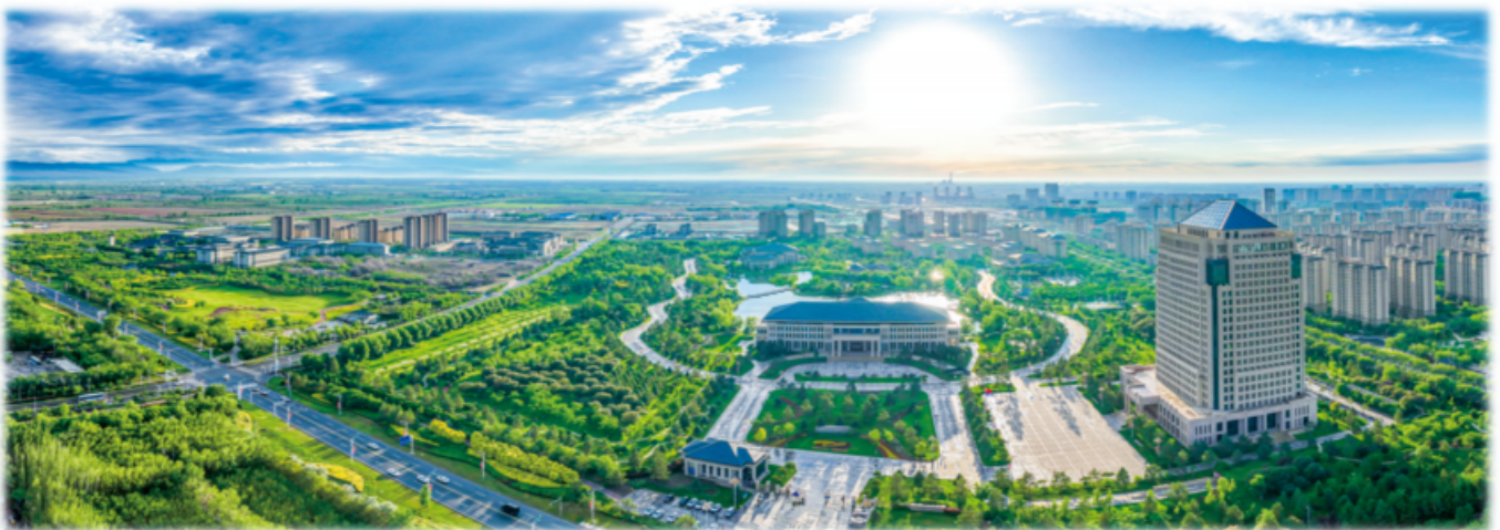
上图：特变电工总部科技研发基地